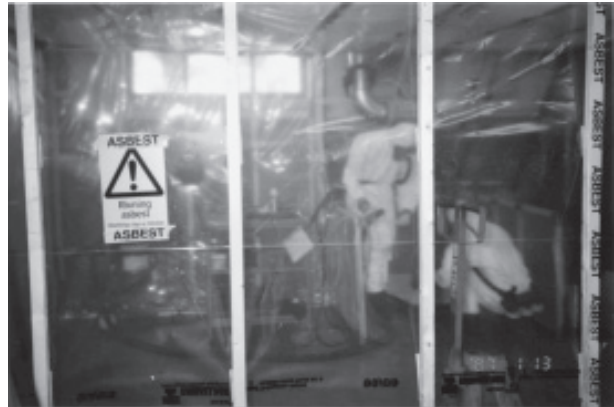
Figura 4. Montaje para obtener el adecuado aislamiento de un trabajo con amianto consistente en la sustitución de una arandela de caucho - amianto de un motor

En la figura 4 se expone un ejemplo de un montaje para obtener el adecuado aislamiento de un trabajo con amianto.