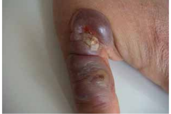
Enfermedad de Orf