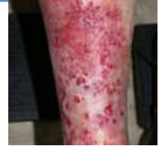
Foto 1: Piodermitis

Las infecciones bacterianas constituyen a menudo infecciones secundarias a microtraumatismos como cortaduras, pinchazos o abrasiones cutáneas. Se presentan como pápulas jalonadas por una pústula, nódulos inflamatorios y dolorosos o, en su forma más severa, como una celulitis o una erisipela.