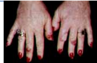
Foto 10: Nódulo de los ordeñadores

El periodo de incubación aproximado oscila entre 7 y 10 días.