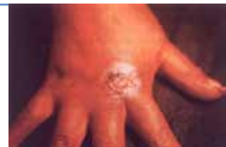
Foto 8: Esporotricosis

Son raras en España, siendo la actinomicosis y la esporotricosis las únicas que se observan en trabajadores del campo y jardineros.