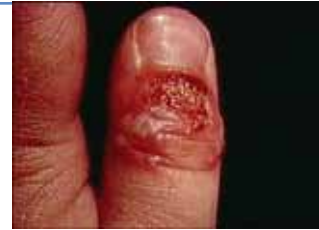
Foto 8: Panadizo Herpético

El periodo de incubación aproximado oscila entre cinco y siete días.