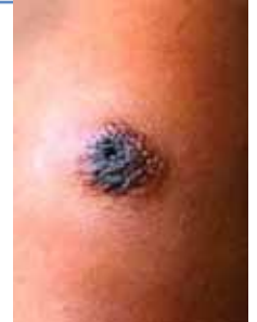
Foto 2: Ántrax cutáneo

Clínicamente son lesiones indoloras que pueden acompañarse de linfadenopatía regional, acompañándose de malestar general y fiebre.