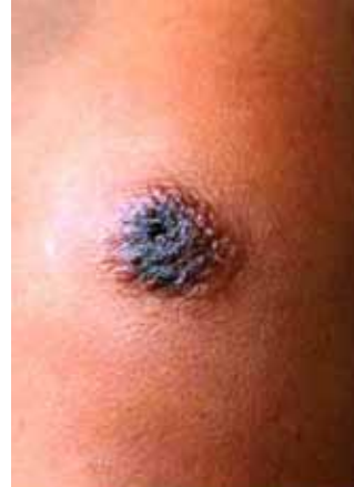
Foto 2: Ántrax cutáneo http://www.ucsm.edu.pe/ciemucsm/pages/antra.htm