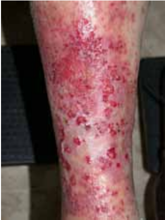
Foto 1: Piodermitis