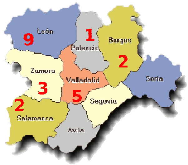
Accidentes mortales en centro de trabajo

UGT demanda a la Administración la creación de consultas y unidades médicas específicas para las enfermedades por amianto.