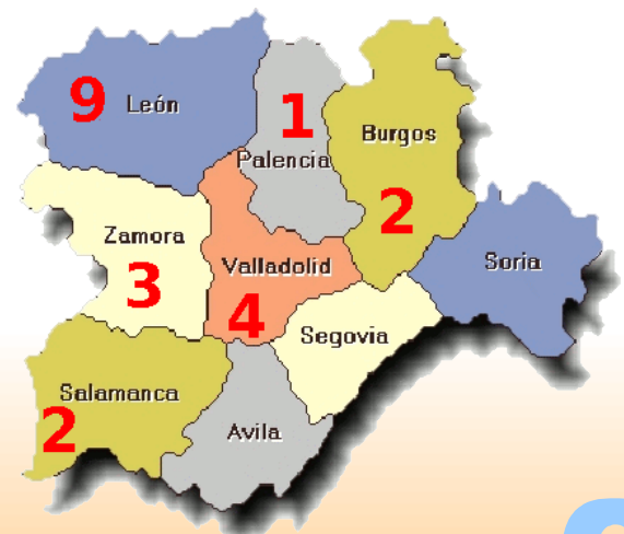
Accidentes mortales en centro de trabajo