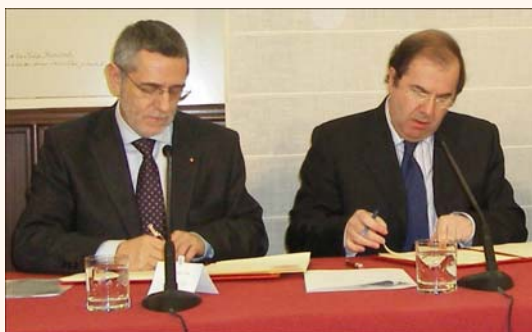
El Secretario Regional de U.G.T. – Castilla y León y el Presidente de la Junta de Castilla y León durante la firma del Acuerdo.

Durante el año 2006 fallecieron 1352 trabajadores y trabajadoras en accidente de trabajo, 63 de ellos eran trabajadores de Castilla y León.